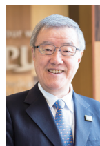
講演/出口治明 立命館アジア太平洋大学長 演題:コロナ時代の 絆(きずな)